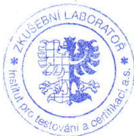
Doc. Ing. Vladimír Klepal, CSc. vedoucí zkušební laboratoře

Objednavatel: PRAGOELAST spol. s r.o. IČ: 62954610 Adresa: Na Cikánce 2 153 02 Praha 5 - Radotín Vzorek: Pryžový kompozit na bázi druhotných surovin: GR 850 FS Zadání: Hodnocení technických parametrů viz. str. 2 Datum přijetí vzorku: 4. 3. 2009 Vypracoval: Miroslava Špendlíková Místo a datum vydání: Zlín, 1. 4. 2009