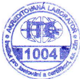
Doc. Ing. Vladimír Klepal, CSc. vedoucí akreditované laboratoře

Objednavatel: PRAGOELAST spol. s r. o. IČ: 62954610 Adresa: Na Cikánce 2 153 02 Praha 5 – Radotín Česká republika Vzorek: Protipádová deska FSPL, tloušťka 30 mm, 40 mm, 50 mm, 60 mm. Protipádová deska FSPL profil 1M4, tloušťka 43 mm, 45 mm. Protipádová deska FSPL profil M4, tloušťka 70 mm, 75 mm, 80 mm. adání: Stanovení kritické výšky pádu podle ČSN EN 1177 Datum přijetí vzorku: 07. 02. 2006, 10. 12. 2008, 02. 02. 2009 Vypracoval: Ing. Petr Geryk Místo a datum vydání: Zlín, 05. 02. 2009